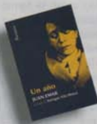
UN AÑO Juan Emar Barataria. 120 págs. 10 €.