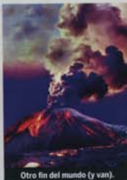
Otro fin del mundo (y van).