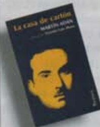
LA CASA DE CARTÓN Martín Adán Barataria. 120 págs. 10 €.