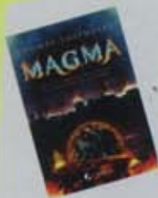
MAGMA Thomas Thiemeyer Viamagna 544 págs. 19,95 €